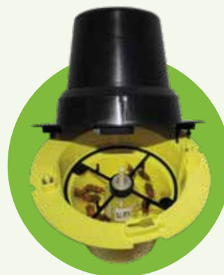
Sopra: immagine della trappola Pitfall contenente RHYNCHO Pro Classic®